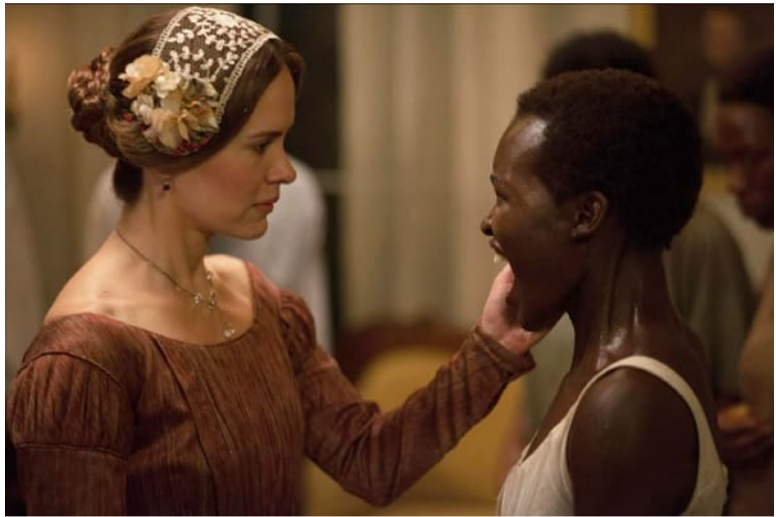
FILMMAKAREN. Paul Weller, Elliott Heffernan och Saoirse Ronan i nya filmen Blitz . Till höger scen ur Oscarsvinnaren 12 Years a Slave från 2013 med Sarah Paulson och Lupita Nyong'o i rollerna.

N är Steve McQueen dyker upp bakom skärmen på kontoret i Amsterdam har assistenten redan hunnit be om ursäkt för förseningen. Under intervjun lyssnar den brittiske regissören och konstnären noga på frågorna och väljer sina ord med omsorg, trots att han är mitt uppe i lanseringen av sin nya film. Ingenting görs halvdant.